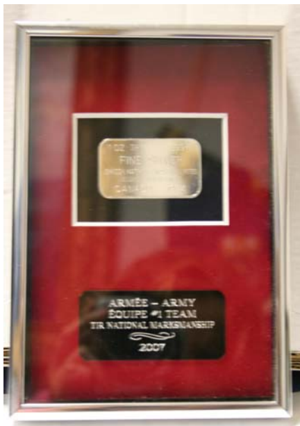
Modèle de plaque souvenir en argent (boîte à relief)

Ce trophée a été réintroduit à la Compétition nationale de tir en 2006 pour la meilleure équipe des cadets de l'Armée.